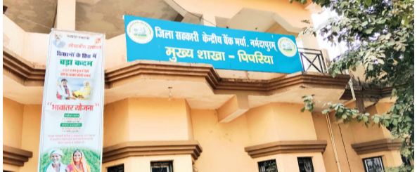
हरिभूमि न्यूज || पिपरिया

जनपद पंचायत के किसानों को मध्य प्रदेश शासन द्वारा पिछले वर्ष आर्थिक सहायता देने के लिए क्रेडिट कार्ड वितरित किए गए थे, लेकिन अब तक इन्हें चालू नहीं किया गया है। इससे किसान परेशान हो रहे हैं और बैंक के चक्कर लगा रहे हैं।