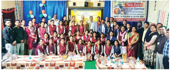
हरिभूमि न्यूज || सविनी मालवा